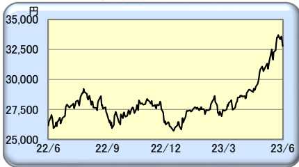
<日本株 (日経平均) >