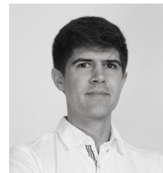
ポートフォリオ・ マネジャー