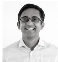
ポートフォリオ・ マネジャー